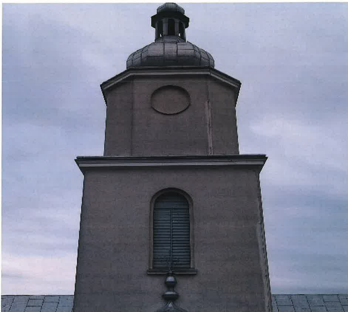
3. Uzupełnienie brakującego gzymsu, malowanie gzymsu oraz elewacji kościoła.